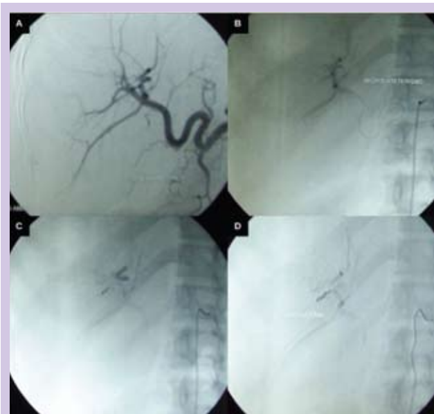
Figura 2: Embolização arterial: (A) Artéria hepática pré-embolização. (B) Microcateterismo coaxial de ramos segmentares do lobo hepático direito. (C) Obliteração com coils de sítio nutridor da área de ruptura. (D) Controle final.

angioarquitetura compatíveis com hemangioma, com embolização do foco sangrante (Figura 2).