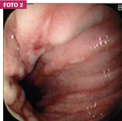
(B) Pequena úlcera rasa, fusiforme, com fundo fibrinoso esbranquiçado com diminuto coágulo no seu centro.

Endereço para correspondência: e-mail: eduardoghdemoura@gmail.com. Recebido em: 04/01/2012. Aprovação em: 31/03/2012.